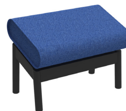
JACKIE FOTPALL 538