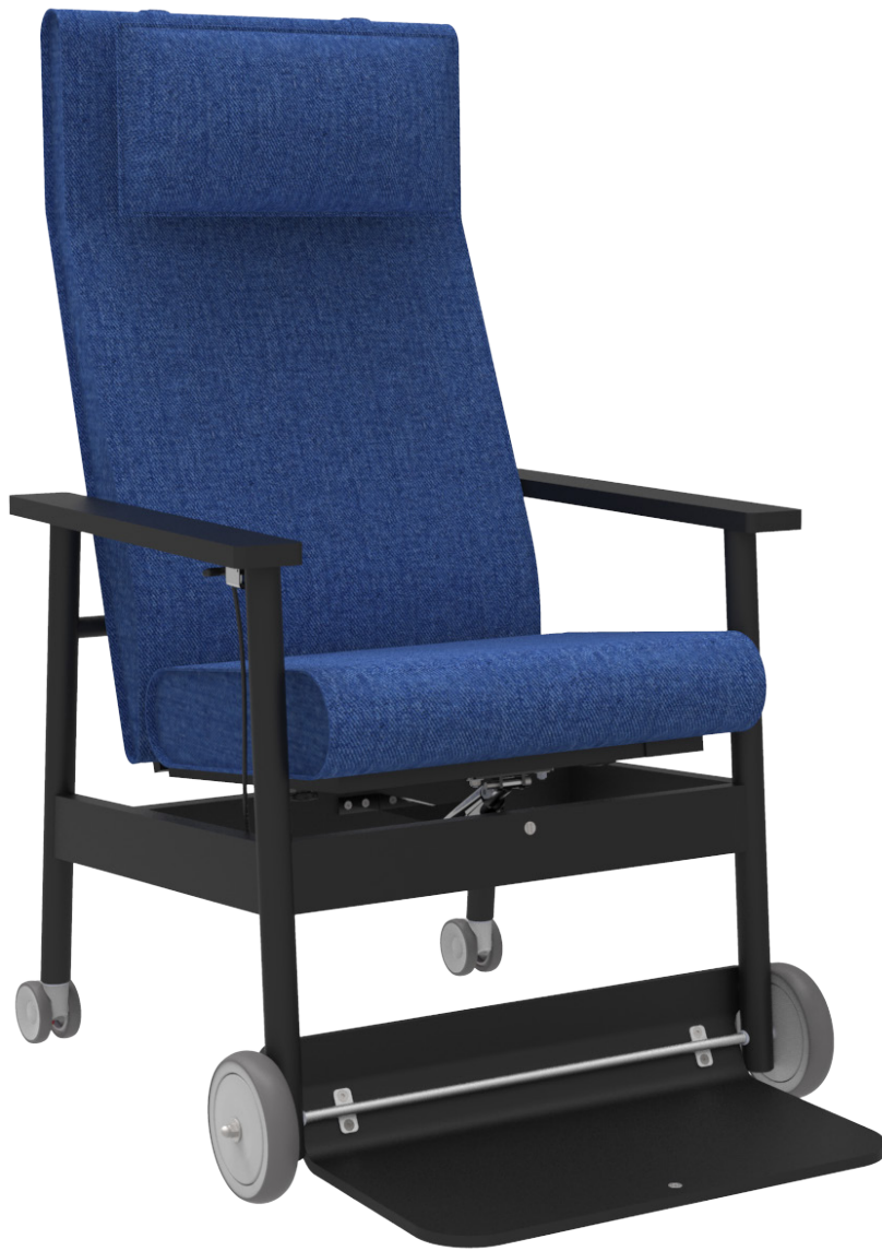
JACKIE FUNKTION DESIGN: PETER ANDERSSON